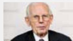
Hedersordförande Peter Wallenberg född 1926

Styrelseutskott Ledamot: Revisionsutskott Aktieinnehav i Investor 1) 57.598 Syntetiska aktier 7.915